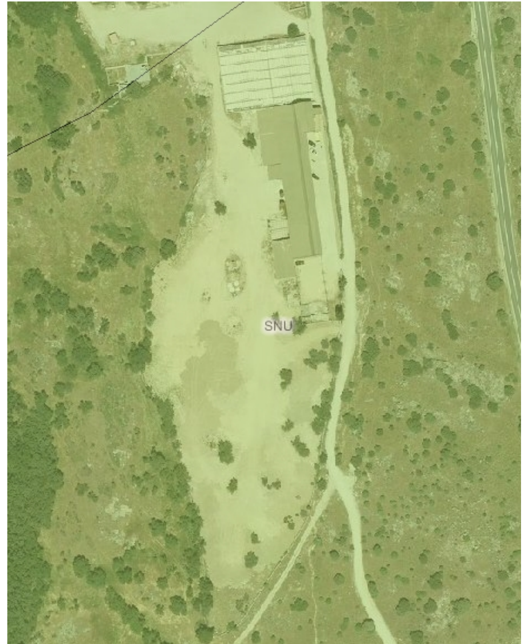
ORTOFOTO AÑO 2007