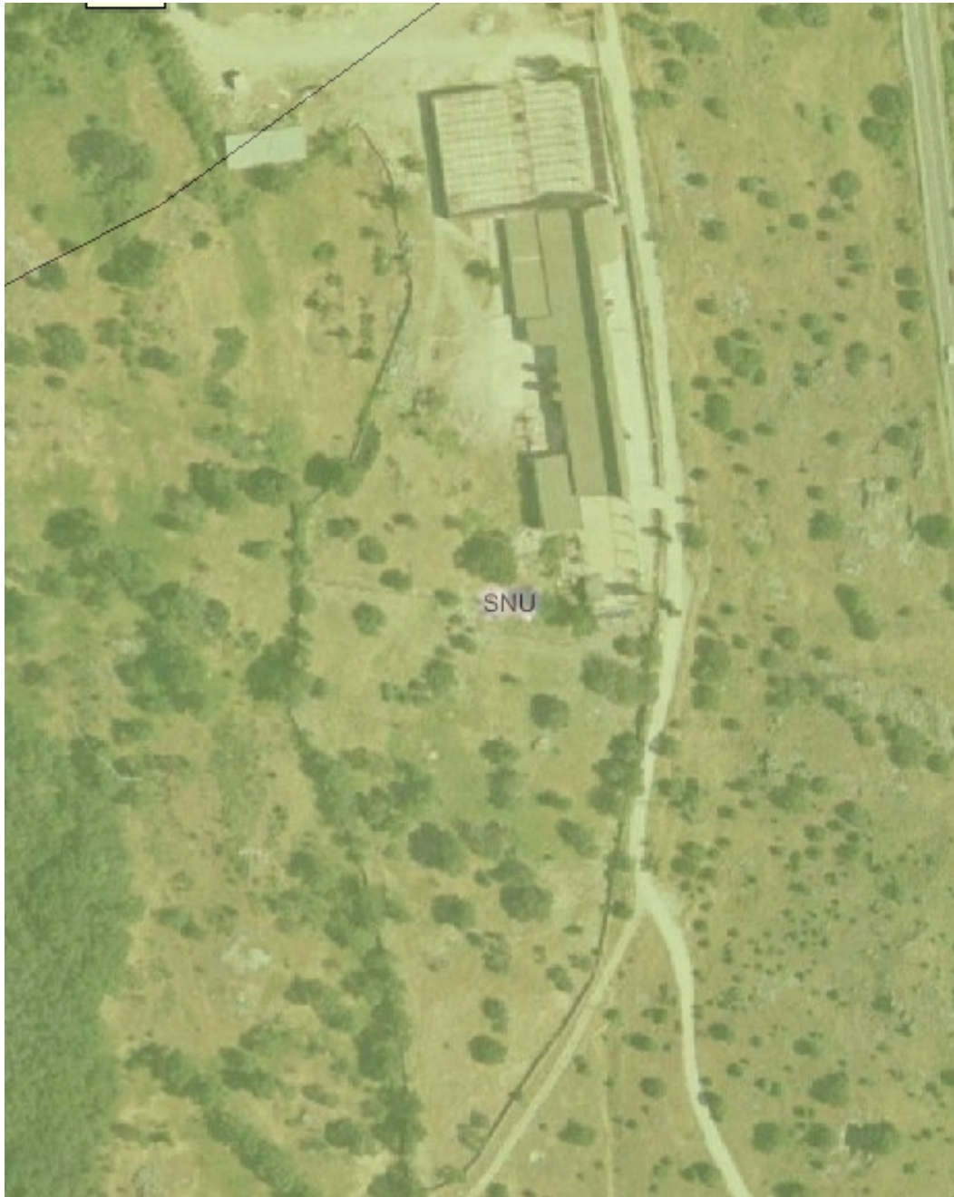
ORTOFOTO AÑO 2004